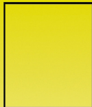
Abb.: „Nietzsche-Triangel“, 2018, ©Hans-Peter Klie /www.hans-peter-klie.de

Schloss Grochwitz Grochwitzter Kunst Garage Schlossallee 1 04916 Herzberg (Elster) Telefon: 03535-24824-0 www.schloss-grochwitz.de